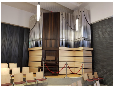
Die neue Bente-Orgel mit zwei Manualen, Pedal, Schwellwerk und 23 Registern.