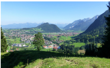
Wunderschönes Allgäu: Blick auf Pfronten

Diakonin Andrea Spremberg oder im Kirchenbüro