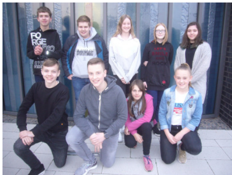
Die Konfirmand*innen aus Willehadi.