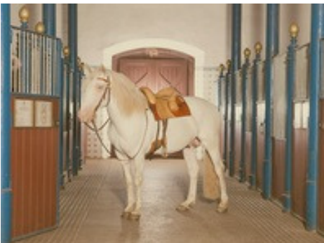
Fürstliche Hofreitschule: Blick in den Marstall

Bitte melden Sie sich im Gemeindebüro für die Fahrt an. Gerne auch telefonisch. Der Beitrag beläuft sich auf € 15,- (ohne Bewirtung in der Schlossküche). Wir freuen uns auf Sie!