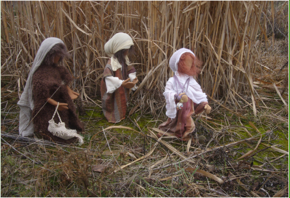
3 Frauen auf dem Weg zum Grab... (siehe „An(ge)dacht“ auf S. 2)