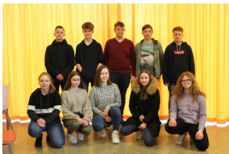
Die Konfirmand*innen aus Alt-Garbsen (Sonntag, 12. Mai, 10 Uhr); Namen auf S. 18!