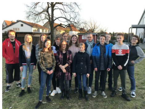
Die Konfirmand*innen aus Havelse und Marienwerder.