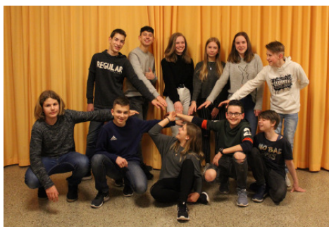
Die Konfirmand*innen aus Alt-Garbsen (Sonntag, 12. Mai, 12 Uhr)