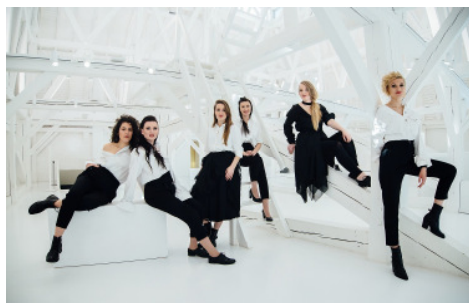
Latvian Voices - A cappella aus Letland!

Das Repertoire des Ensembles (sechs junge Sängerinnen aus der lettischen Hauptstadt Riga) ist breit gefächert und besteht aus eigenen Arrangements von lettischen Folksongs, Renaissance- und Barockstücken, Liedern der Klassik wie auch Evergreens.