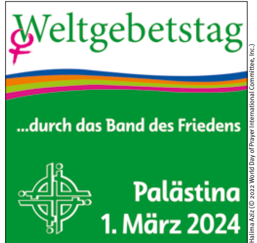
Titelbild Weltgebetstag 2024: „Praying Palestinian Women“

Herzliche Einladung zu den Vorbereitungsterminen , die unabhängig voneinander zu besuchen sind, weil sie nicht unmit-