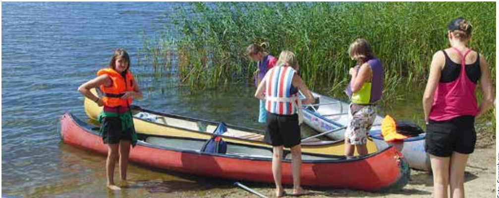
Mit dem Kanu unterwegs in Schweden