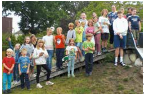
Gruppenbild der letzten Kinder-Bibel-Nacht

alle zum Gewinn. Ein neues Team fand sich zusammen, dass vor allem aus Debütant*innen für die Kinder-Bibel-Nacht bestand; von der Konfirmandin bis zur Erwachsenen, die alles gemeinsam mit mir geregelt haben. Und die spendenfreudigen Eltern sorgten für eine positive finanzielle Bilanz, ganz abgesehen von ihrer Dankbarkeit dem Team gegenüber. Das rührt ans Herz. Die Kinder waren zufriede