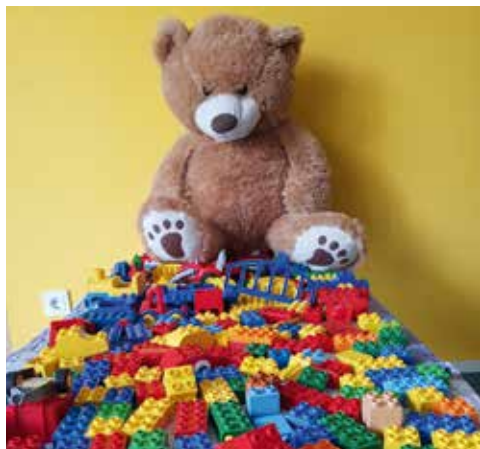
Grüße aus dem Spielkreis