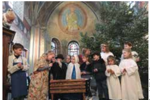
Generalprobe des Krippenspiels 2018