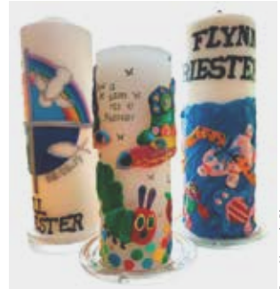
So könnte deine Taufkerze aussehen!