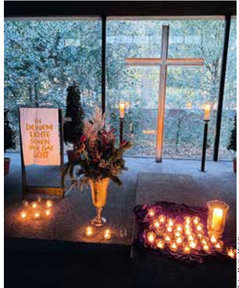
Offenes Angebot in der Kapelle Friedhof Marienwerder

Herzliche Einladung an alle Menschen, die in den letzten Jahren eine geliebte Person verloren haben.